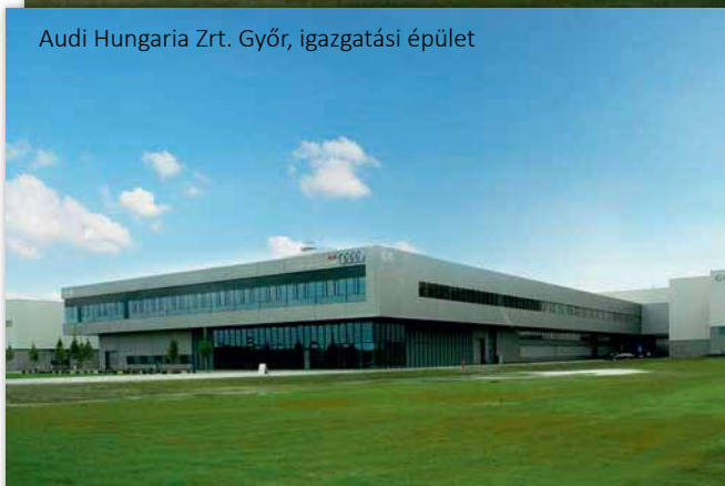
Audi Hungaria Zrt. Győr, igazgatási épület