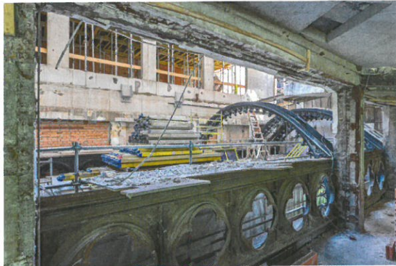
➔ A felújítás és bővítés komoly kihívást jelentett a tartószerkezeti szakágnak is