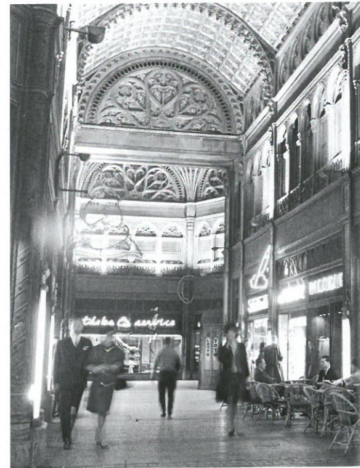
➔ A Párisi udvar passzázsja 1964-ben

Az iroda-, üzlet- és bérház kisebb sérülésekkel, mondhatni szerencsésen átvészelte a II. világháborút, azonban 1949-ben államosították, és története során először átalakították. A homlokzat azonban a II. világháborúban és az 1956-os forradalom alatt rongálódott meg legjobban. Ekkor a járdától az erkélyek szintjéig a homlokzati burkolatok nagy része elpusztult. A javítási munkálatokra a hatvanas évek elején került sor, a korabeli elveknek megfelelően az alsó három szintet gyakorlatilag teljesen kicserélték. A földszinti portálok nem maradtak meg, néhány eredeti tölgyfa ajtót leszámítva ezeket silány minőségű szerke-